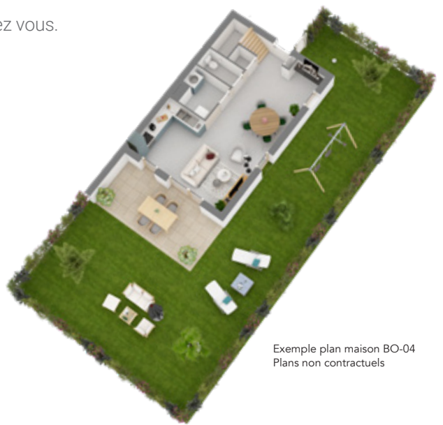
Exemple plan maison BO-04 Plans non contractuels